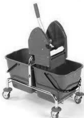
Podwójne wiadro na kółkach