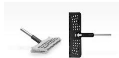
Podwójny mop do wycierania z mikrofibry