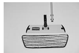
Mop do wycierania z mikrofibry